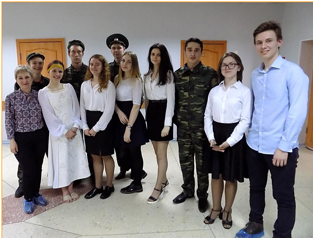
Участники театрализованного представления.

Рассказывая об этой трагичной странице в истории нашего государства участники представления говорили о том, что как много и как мало мы о ней знаем. Она ушла в историю и за неполных десять лет (1979-89г.г.) унесла многие тысячи жизней воинов-интернационалистов. Это война своим черным крылом коснулась многих наших семей, принесла с собой цинковые гробы, безногих, безруких, слепых, тяжело больных молодых людей. Война в Афганистане – это горе, прежде всего, тех, кто в ней участвовал.